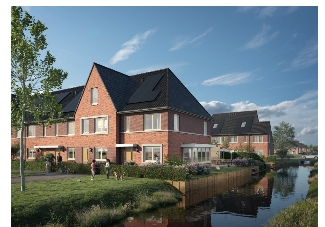
Rijwoningen type "Hemmen" (H)

Sliedrecht Baanhoek-west - deelplan Het Buurtschap fase 2A