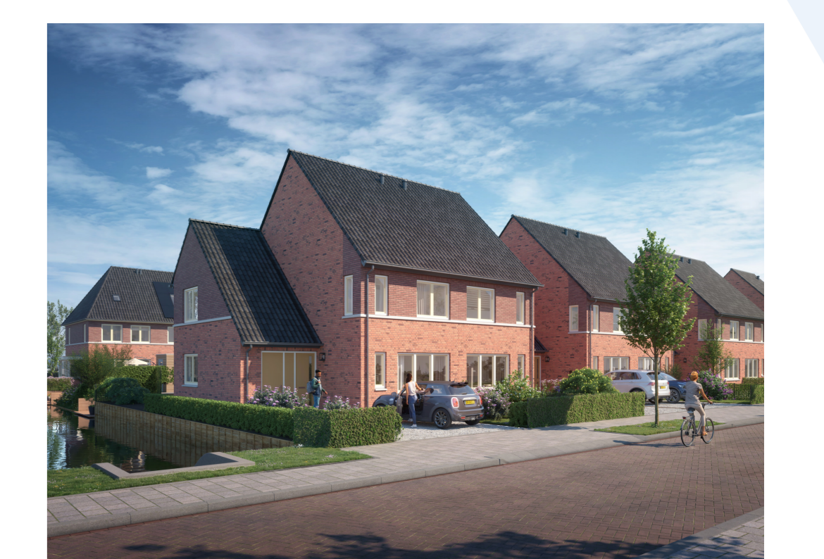
Herenhuizen type "Winkler" (W)